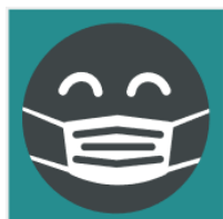
MNS tragen - andere schützen