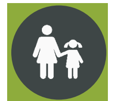
Eltern & Begleitpersonen sind verantwortlich, dass Kinder die Verhaltensregeln einhalten